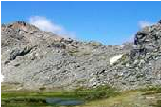
FIGURA 4. Imagen de Laguna Tomate, de 15 km de extensión.