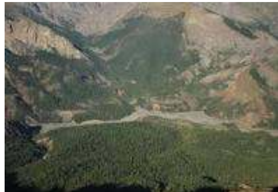
FIGURA 4. Imagen de Valle del Venado, de 17 km de extensión.