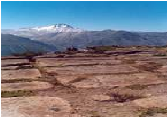
FIGURA 3. Imagen de Enladrillado, 10 km de extensión.