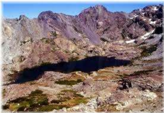
FIGURA 2. Imagen de Laguna del Alto, de 4 km de extensión.