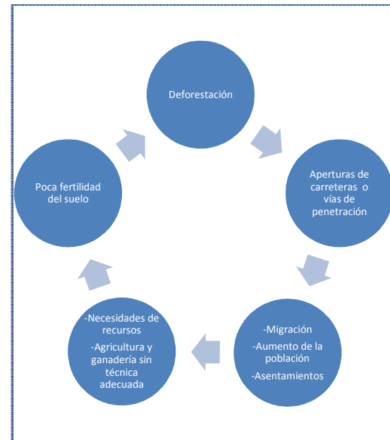
FIGURA 2. Círculo vicioso entre deforestación y construcción de rutas.

Avalanchas por la construcción de caminos en zonas de montaña con alta pluviosidad. Corte de sistema de drenaje creando lagunas donde se encuentran la población del caimán cerca de la carretera Cartagena-Santa Marta en Colombia.