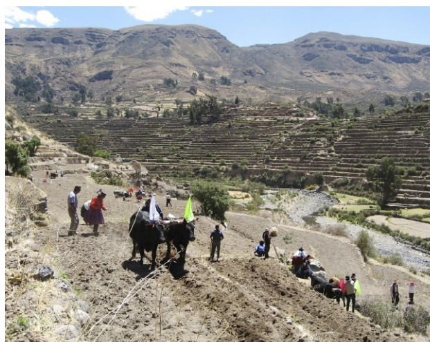
Imagen 2. Preparación del terreno Agrícola

Otra de las evidencias materiales de uso y manejo del territorio altoandino en el Valle del Sondondo es la utilización de corrales para ganado camélido. A la fecha nos permite constatar el carácter intensivo y complejo del mismo, y cómo su distribución estuvo directamente asociada a las áreas de ampliación de bofedales desde tiempos prehispánicos. Destaca la concentración de estos corrales en la zona de Chuycuñapampa ubicada en el distrito de Cabana. Se considera que los más pequeños pudieron ser centros de empadre; y los “corrales” rectangulares pudieron haber sido utilizados en el Chaccu.