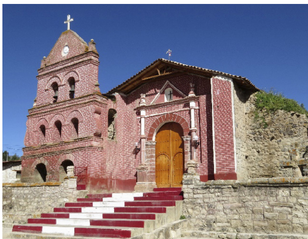
Imagen 7. Templo de la Virgen Inmaculada Concepción de Aucará.

panario, etc. Vale mencionar que alrededor del templo surgieron numerosas expresiones culturales asociadas al culto de sus santos patrones: La Inmaculada Concepción, San Miguel Arcángel y en el siglo XX se agregó el culto a Señor de Untuna, lo que convierte al templo en un santuario regional.