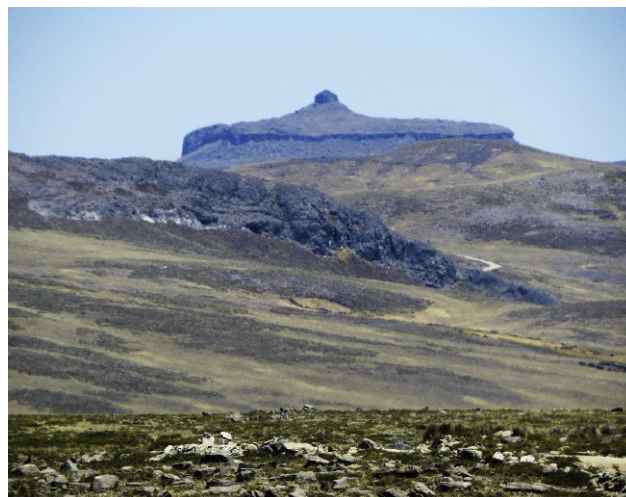
Imagen 4. Apu Osconta 4100 m.s.n.m..

En general estas expresiones culturales están asociadas a prácticas de pago tanto para los ganaderos, agricultores y grupos vinculados como los danzantes de tijeras, estos últimos realizan el “pago” no solo en el contexto natural del sitio sino también en las plazas de los centros poblados, así como las torres de las iglesias, estos pagos son usualmente acompañados de un cuerpo de músicos (violínistas, arpista y el propio danzante). El culto a los Apus depende de la ubicación de la estancia o moya, por lo que se “paga” a la montaña más próxima con el fin de protección y fertilidad. Los pagos hechos en contextos agrícolas incluyen un contenido basado en elementos de celebración como la “coca” y el vino, asimismo alimentos como la “quinua” y el “maíz”.