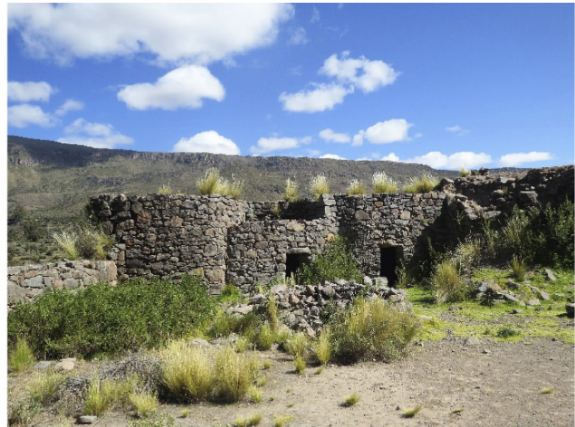
Imagen 6. Sitio Arqueológico Caniche, Carmen Salcedo

Como consecuencia de la transformación del territorio, que se convierte de un espacio inhóspito en uno acondicionado para una vida permanente, se inició una ocupación humana intensiva en el “Valle del Sondondo”. Evidencia de ésta son los diversos sitios arqueológicos dispuestos en los distritos de Cabana, Carmen Salcedo (S.A. Caniche), Chipao y Aucara. Estos sitios arqueológicos se ubican en las zonas agrícolas y en la puna, ambos están asociados a la actividad ganadera. Las evidencias más antiguas están vinculadas a la ocupación en la zona de puna dedicada a la caza y la recolección.