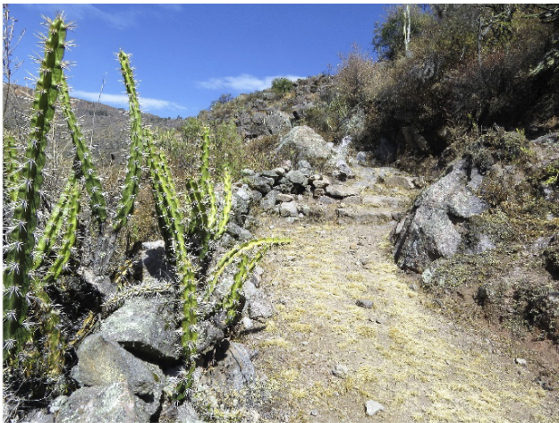
Imagen 5. Qhapaq ñan o camino Inca.

los diferentes pisos ecológicos del valle, sino que lo articulaban a la red de caminos hacia la costa y el Cuzco. Destaca el camino Inca principal que viniendo de Nasca (en la costa) cruza las Pampas Galeras y pasando por el Cerro Osconta (distrito de Cabana) desciende hasta Aucará y continúa camino hacia Ccecca (distrito de Chipao) y desde allí a Soras y Sondor (Andahuaylas) rumbo al Cuzco. De este tramo principal se derivan ramales secundarios que conectan con el valle del Negromayo y el Mayobamba, afluentes del “Valle del Sondondo”.